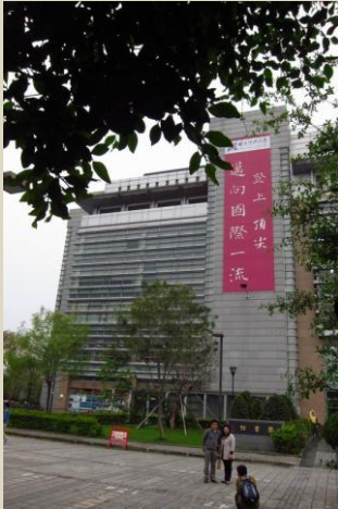
國立中興大學圖書館

位於台中市南區的國立中興大學創立於1919年，是台灣歷史最悠久的國立綜合大學，也是台灣中部地區唯一獲教育部評選的頂尖研究型大學，學校規模為全國國立大學的第三大。在國內高中生最想就讀的大學中，中興大學排全國第七位。大學致力規劃發展最具世界級競爭力的生物科技和永續發展科技兩大領域，在農業科技、植物與動物科學、化學、工程、材料科學、生物與生物化學、臨床醫學、電腦科學及環境／生態學表現優異，名列基本科學指標全球前1%。全台灣只有四所大學開辦獸醫課程，國立中興大學是其中一所，每年從不同途徑共取錄3位香港學生。