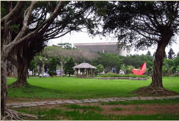
元智大學校園一角

這所私立桃園內壢的大學去年取錄了 58 位香港學生。元智大學名列英國泰晤士報高等教育特刊 2011-2012 年世界大學排行榜前 400 大，並於 2012 年獲評為全球百大潛力大學。元智大學的管理學院及資管系全數通過美國國際商學院聯合會 (AACSB) 認證，而工程及電機通訊學院亦通過中華工程教育學會認證。除此之外，校園景觀是元智大學的一大特色，多幢教學樓曾獲不同的建築設計獎。大部份校園的建築物外牆都是以混凝土為主，營造學院氣色的同時亦不失時代感。