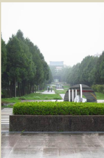
連接圖書館與行政大樓的「勵學坡」

位於台中南投縣埔里鎮，校園總面積達150公頃，校園環境非常優美。國立暨南國際大學自1995年設校，歷史雖不算悠久，但已開設有文、教育、管理、科技四個學院。國立暨南國際大學重視學生外語能力，每位學生除了必須修讀英文課外，更要選修第二外語。大學亦為學生爭取多元國際交流機會。我們有幸能跟三位來自香港的學生交流，他們說大學最大特色在於多姿多采的校園生活，學生須修讀特色運動，例如輕艇、馬術、射箭、高爾夫球等。此外，學校社團亦超過50個，別具特色，同學都享受其中。