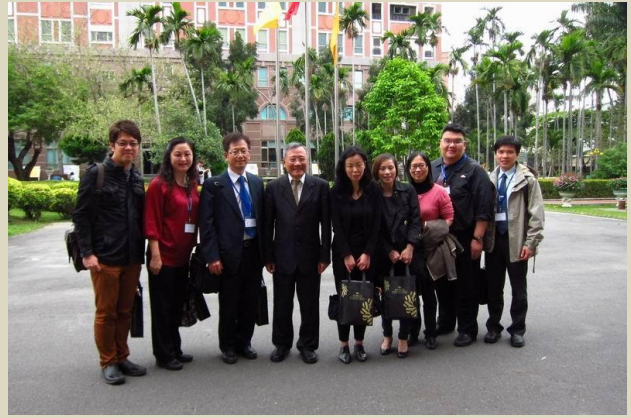
與南台科技大學戴謙校長留影