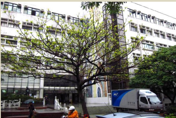
淡江大學校園一角

此綜合型大學在「世界大學網路排名」位列台灣私校第一名，教學理念為國際化、資訊化和未來化。淡江大學在台灣首創「大三出國研習」，國際企業學系及蘭陽校園所有大三學生均須出國留學一年。而電機系師生屢次在 FIRA 世界機器人足球賽獲得冠軍。淡江大學亦在不同的畢業生評價調查中連續多年獲得第一名。現時有超過 200 位港生就讀淡江大學，比較多港生會選讀商管和外語系。大學亦會為境外新生提供入學輔導，包括學長姐制度、新生約談等，幫助僑生適應校園生活。