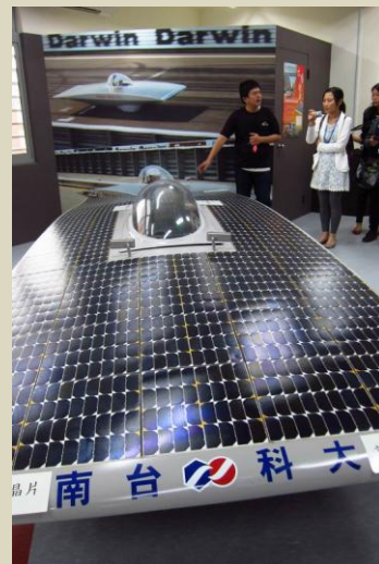
學生自行研發的太陽能賽車