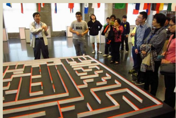
電腦鼠走迷宮示範