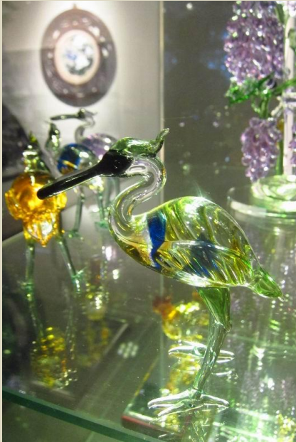
玄奘大學學生的玻璃工藝製品

玄奘大學是由佛教界集資興建的大學，強調學以致用，宗教信仰自由，飲食葷素不拘。這所教學型大學共有四個學院，於傳播、設計及社會工作與心理諮商等領域都辦得享負盛名。全校有超過 7000 位學生，現時共有 32 位港生就讀。玄奘大學於最近的《Cheers》雜誌調查榮獲「畢業生職場表現超乎預期大學」。