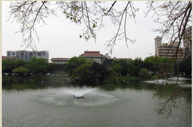
國立中興大學中興湖