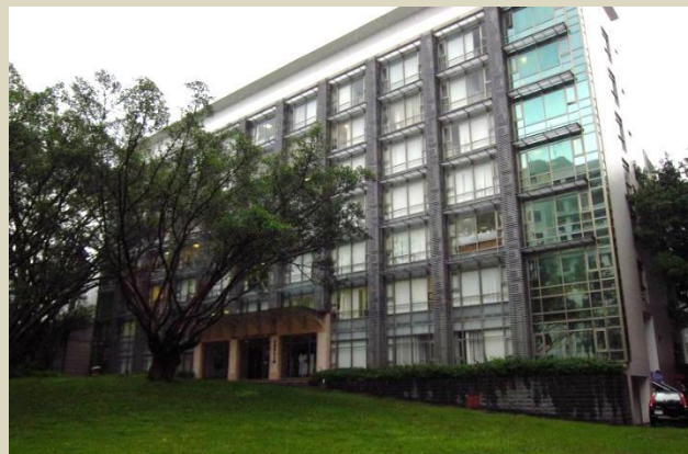
淡江大學語文大樓