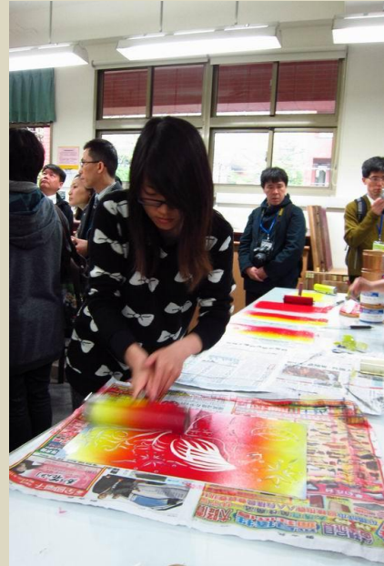
參觀印染工藝設計教室