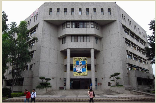
建築物外牆都以混凝土為主