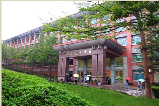
玄奘大學圖書資訊大樓