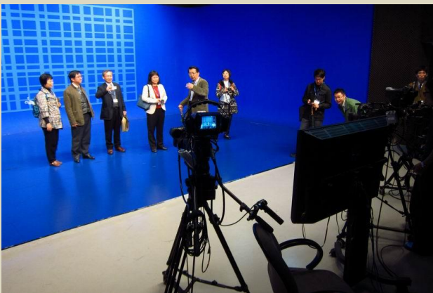
參觀玄奘虛擬攝影棚