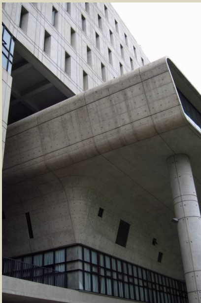
教學樓外型富有時代感