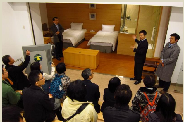
參觀餐旅管理學系教室