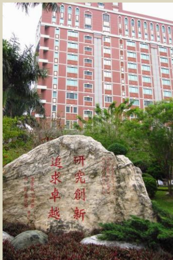
南台科技大學校園一角

這所大學於去年取錄了11位香港學生。南台科技大學是全台唯一一所獲得「典範科技」的私立科技大學，並於2012年《Cheers》雜誌的「企業最愛私立技專校院」調查位列第一名。工學院的七系九所均已通過中華工程教育學會認證，而商管學院亦已通過美國國際商學院聯合會(AACSB)可行性評估。工學院師生在本地及國際比賽屢獲殊榮，例如美國匹茲堡國際發明展、日內瓦國際發明展、台灣智慧型機器人國內及國際邀請賽、中國電腦鼠走迷宮競賽等。南台科技大學積極推動國際交流，舉辦「大三菁英出國」課程，並與26個國家共117所海外大學簽訂姊妹校合約，獲補助經費於台灣大專校院中名列前茅。