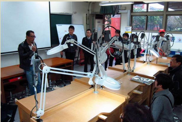
參觀金屬工藝設計教室