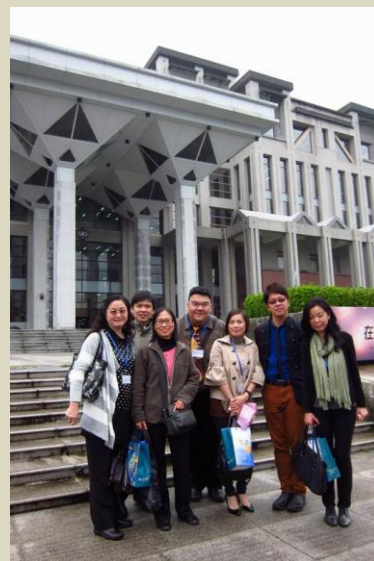
香港輔導教師協會成員於圖書館前留影