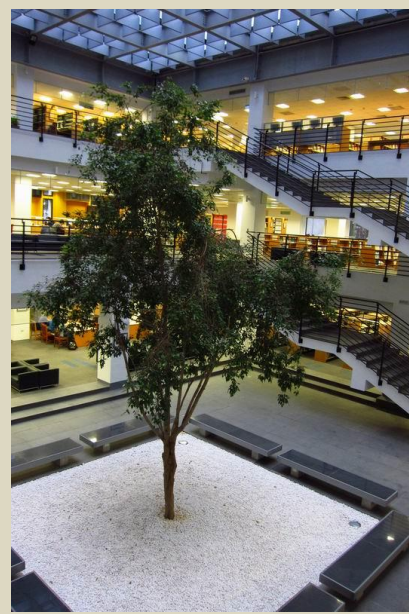
在圖書館中央栽種了一棵樹