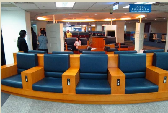
圖書館景觀音樂欣賞區