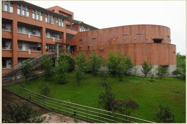
國立暨南國際大學校園一角