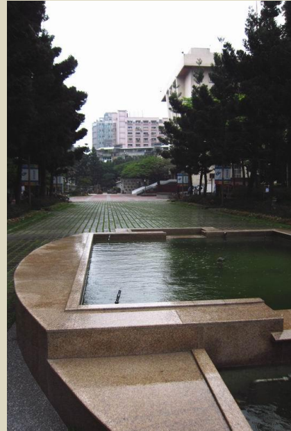
國立台北科技大學校園一角